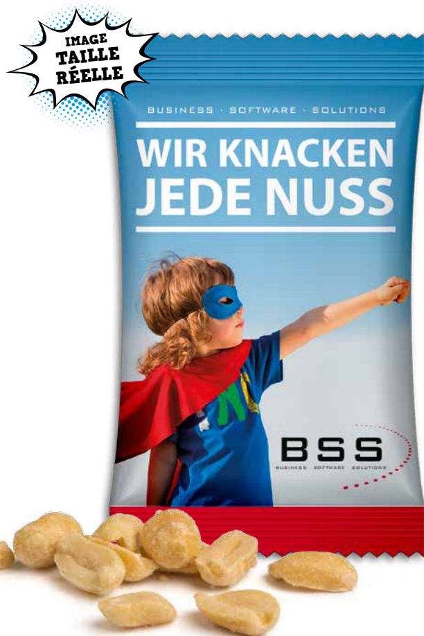
Cacahuètes grillées et salées en sachet personnalisable.