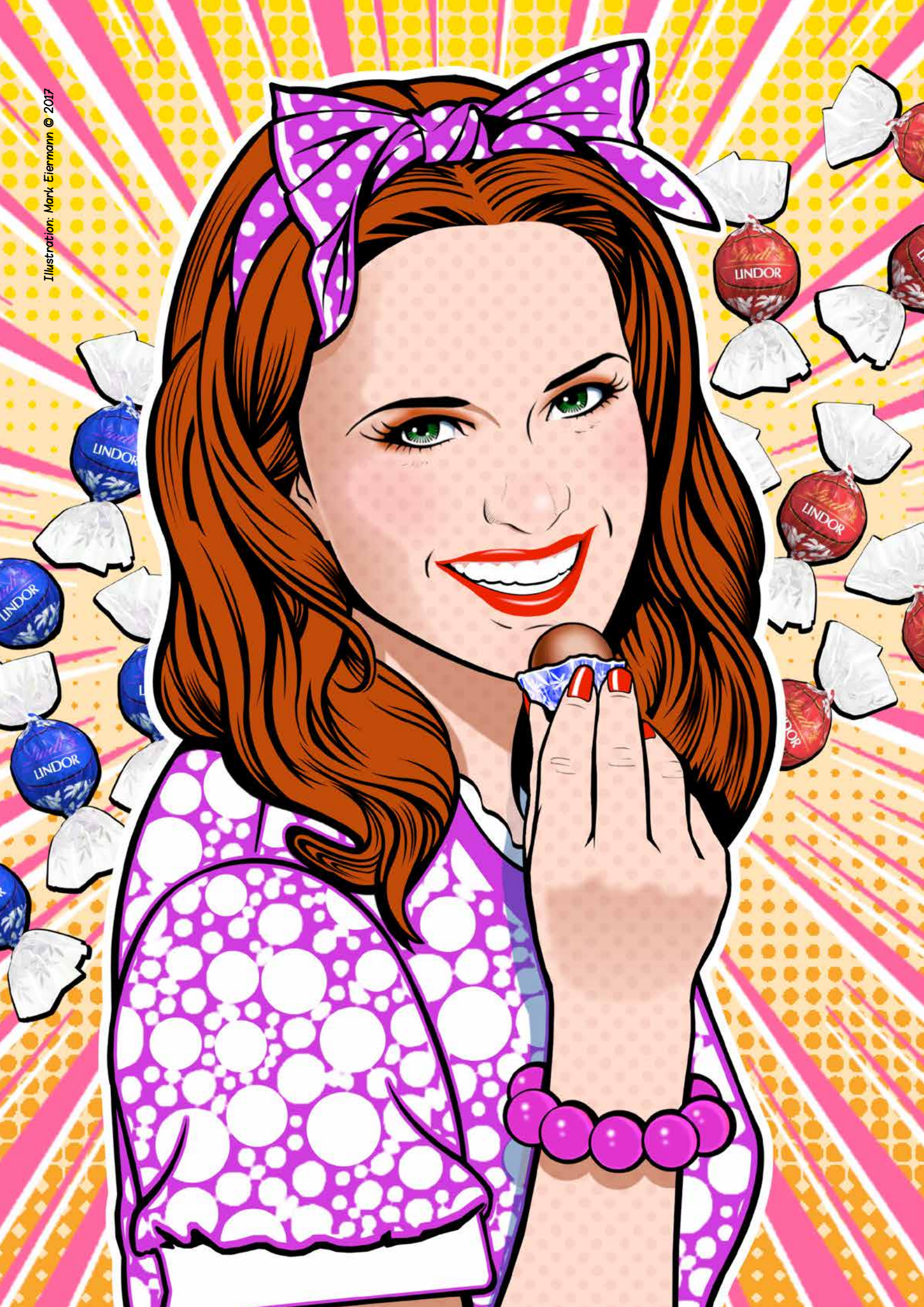
Illustration: Mark Eiermann © 2017