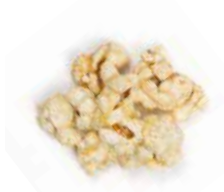
Orange & chocolat blanc