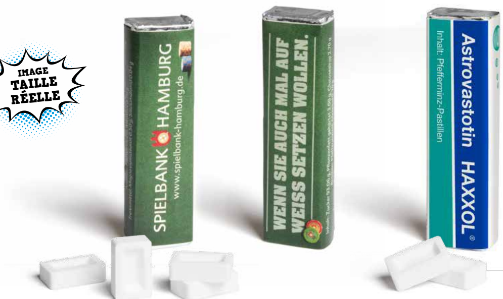
IMAGE TAILLE RÉELLE

12 pastilles de menthe avec sucre emballées dans un bâtonnet rectangulaire personnalisable.