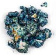
Crème de myrtille