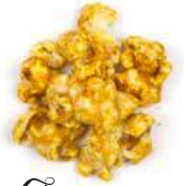
Épice indienne HOT