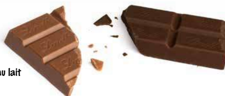
Lindt chocolat au lait