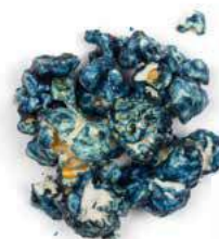
Crème de myrtille