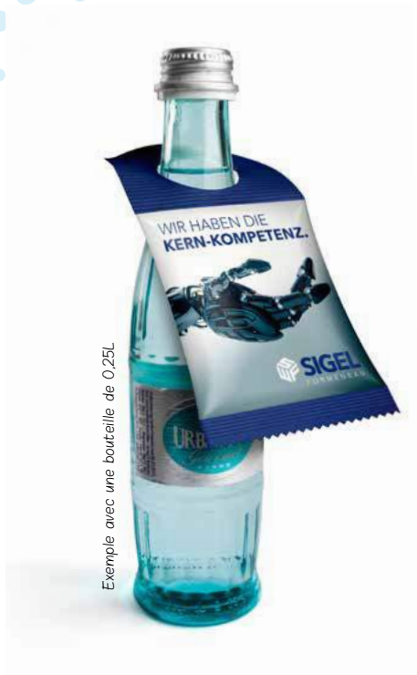
Exemple avec une bouteille de 0,25L