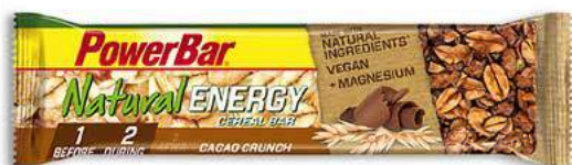
PowerBar NATURAL ENERGY Cacao Crunch