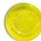
smile (jaune uniquement)