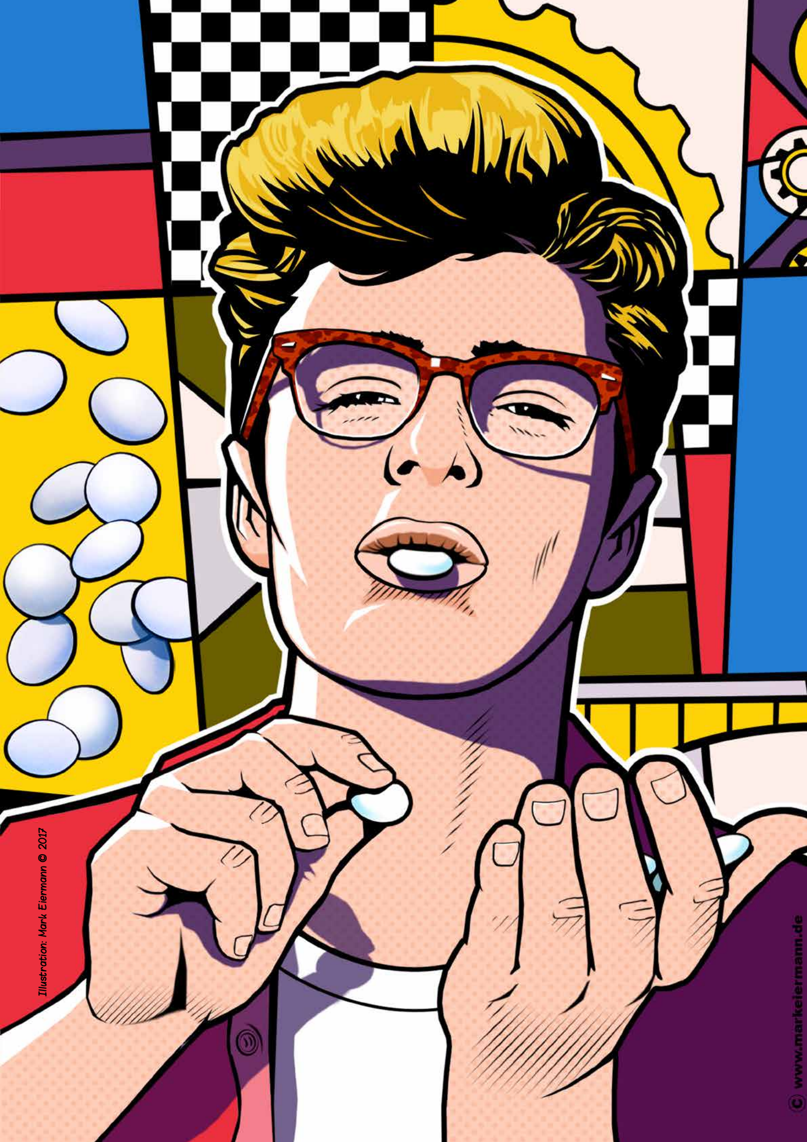
Illustration: Mark Eiermann © 2017