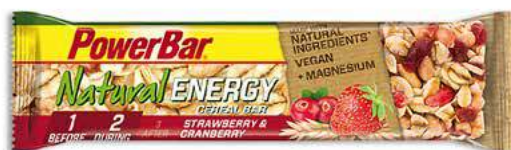
PowerBar NATURAL ENERGY Fraise & Cranberry

Barre POWERBAR ENERGY croustillante aux céréales et au magnésium en deux saveurs différentes dans un étui personnalisable.