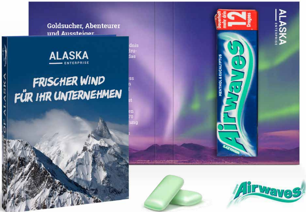
Carte personnalisable et son paquet de chewing gum Airwaves.

Contenu: approx. 18 g Dimensions: approx. 68 x 88 x 13 mm (plié) Conditionnement: 6 x 50 pcs./ 300 pcs. par carton Délai de conservation: approx. 12 mois si produit conservé dans un endroit approprié Délai de livraison: approx. 3 semaines après accord du BAT