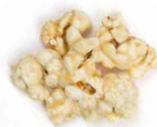
Orange &amp; chocolat blanc