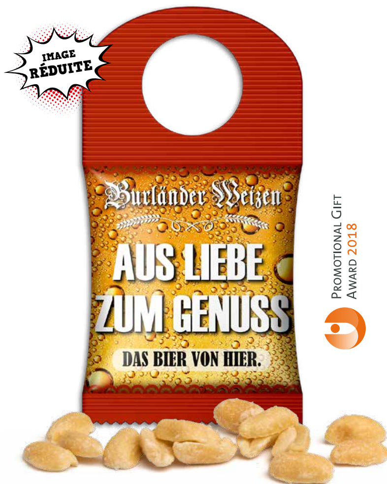
Cacahuètes grillées et salées en sachet bouteille personnalisable.