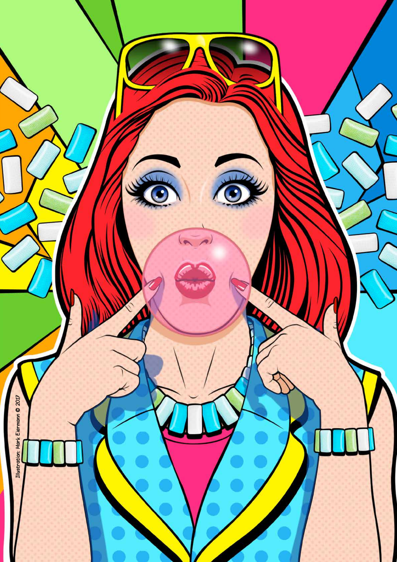
Illustration: Mark Eiermann © 2017