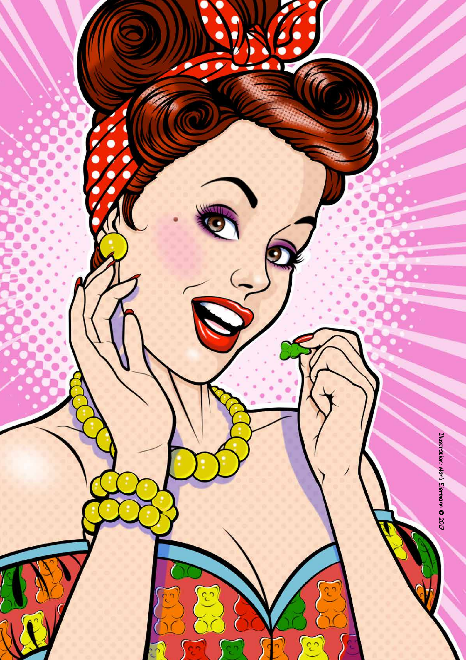
Illustration: Mark Eiermann © 2017