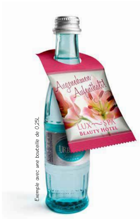
Exemple avec une bouteille de 0,25L