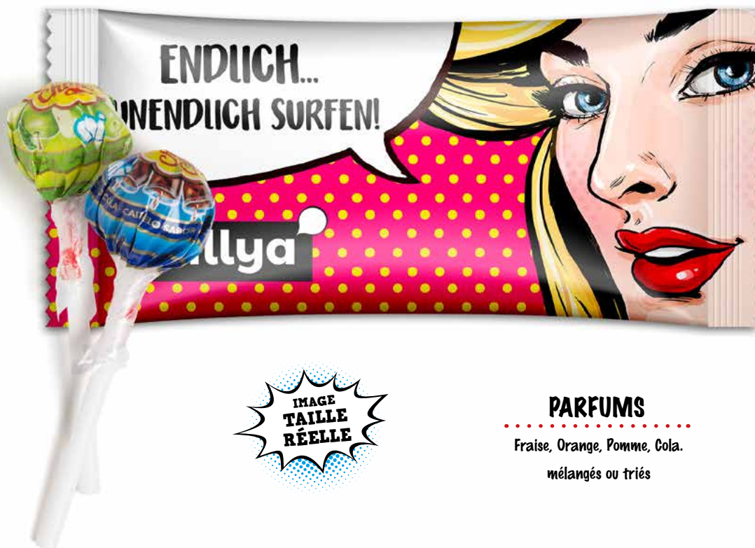
IMAGE TAILLE RÉELLE